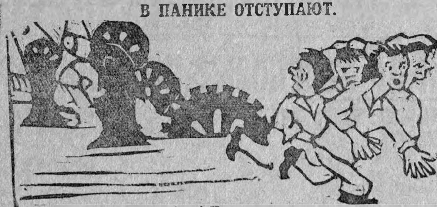
В ПАНИКЕ ОТСТУПАЮТ.

Какие технические достижения имеют ударные бригады мартена они сами этого не знают, разве только сокращение продолжительности завалки, да за время июня донекоторой степени удержались от прогулов. Очень сильно мешает работать бригадам недостаток изложниц и сильно изменившийся состав рабочих, пополненный но-